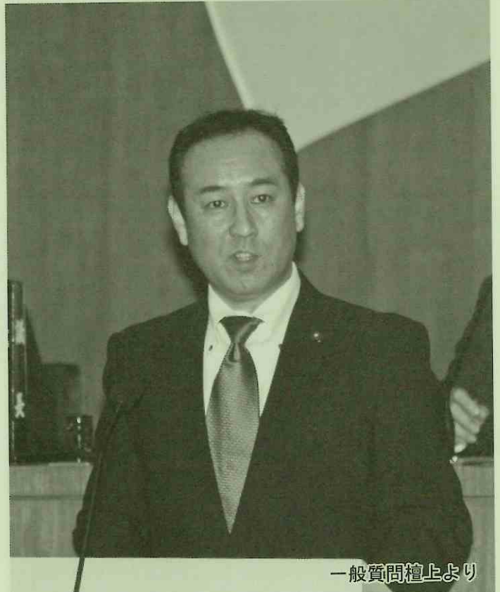
一般質問壇上より