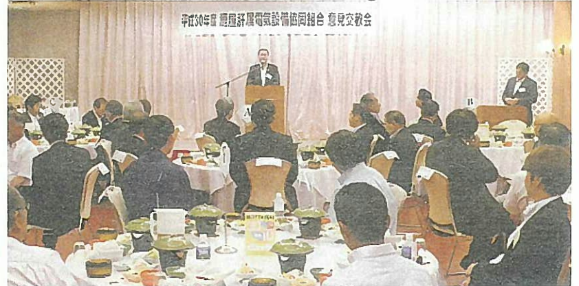
平成30年度 鹿屋肝属電気設備協同組合 意見交歓会挨拶

暑中お見舞い申し上げます。皆様にはお変わりなくお過ごしのこととお慶び申し上げます。去る、4月22日に施行されました鹿屋市議会議員選挙に多くの皆様からのご支持を得て、当選出来ましたことに深く感謝を申し上げます。