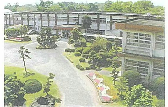
大規模改造予定の串良中