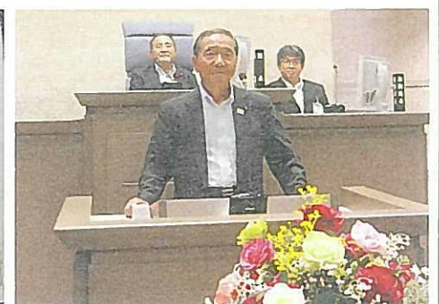
平成30年6月 登壇風景