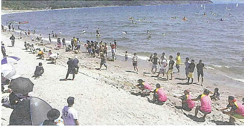
マリンフェスタ(高須海岸)