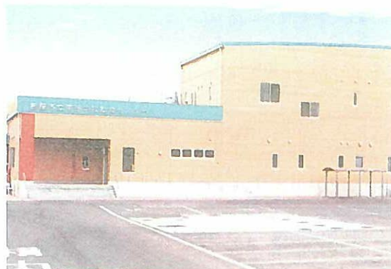
南部学校給食センター

④ 供用開始以降の南部学校給食センターの現状・課題を示されたい。特に、台風など災害時の対応について示されたい。