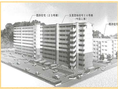
完成イメージ図 玉里団地住宅26号棟

工事名・玉里団地住宅 26号棟新築本体工事 概要・高層耐火構造住宅 (9階建・63戸建1棟) 契約金額・7億5,060万円 契約の相手方・鹿大丸・阿久根・勝特定建設工事 共同企業体