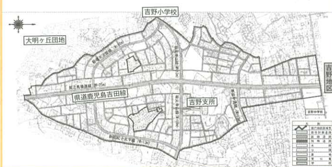
鹿児島都市計画事業 吉野第二地区土地区画整理事業 設計図(案)

区画道路・W11.6~12m 特殊道路・W11.4m 公園・近隣公園1か所 街区公園5か所