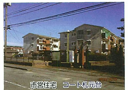
市営住宅 コート札元台

(答弁)・鹿屋市営住宅長寿命化計画は、老朽化した住宅の建替え、長寿命化の改善、解体等による用途廃止についての方針を定め、令和4年度までとなっていたが人口減少や財政状況も踏まえ、計画の見直しを行う。