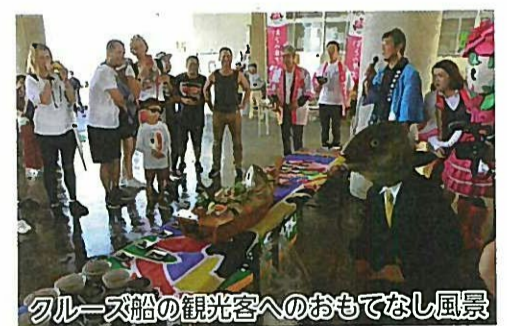
クルーズ船の観光客へのおもてなし風景