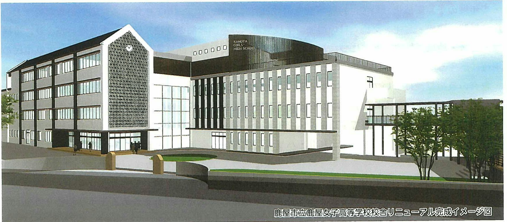
鹿屋市立鹿屋女子高等学校校舎リニューアル完成イメージ図

皆様には、ご家族お揃いでのご新年をお迎えになられたことを謹んでお慶び申し上げますとともに、私の議会・議員活動についても温かいご指導・ご協力を賜りましたことに感謝申し上げます。