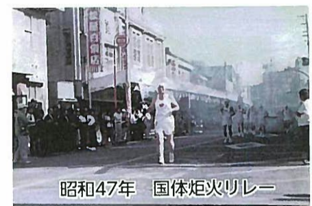
昭和47年 国体炬火リレー