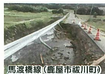
馬渡橋線(鹿屋市祓川町)