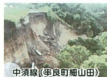
中須線(串良町細山田)