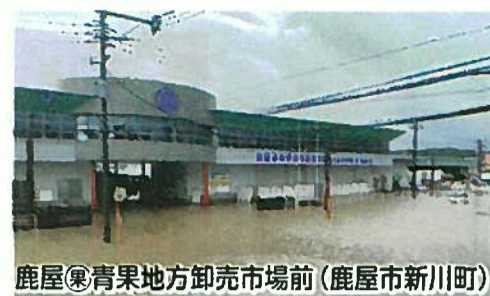
鹿屋◎青果地方卸売市場前(鹿屋市新川町)