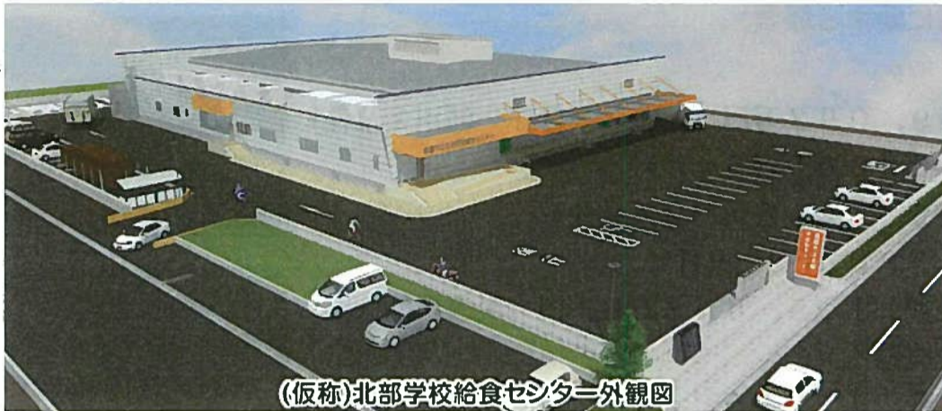
(仮称)北部学校給食センター外観図