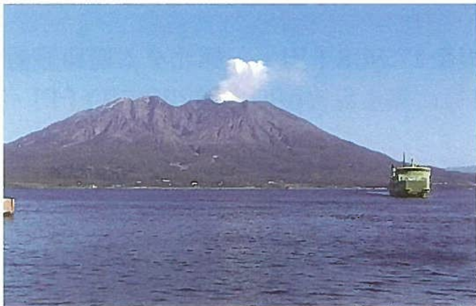
新年を迎える雄大な桜島