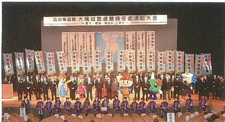
大隅縦貫道の決起集会