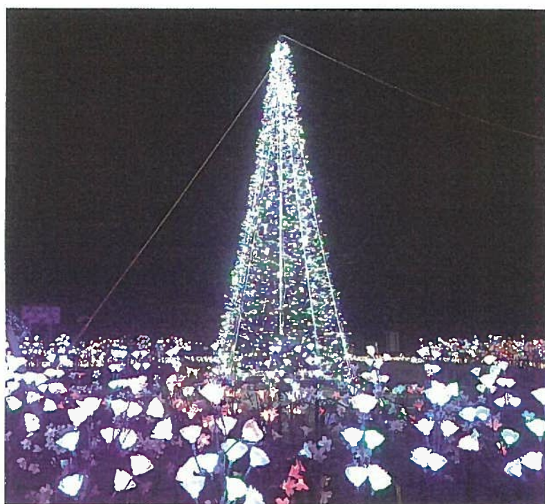
クリスマスファンタジーナイト2022in霧島ヶ丘公園