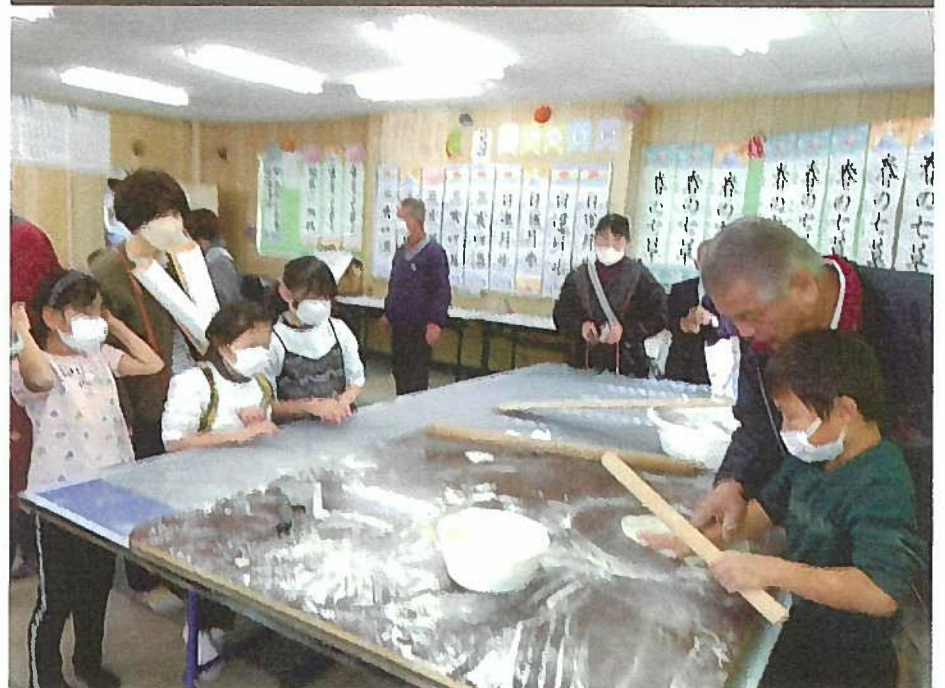
年末収穫祭 (東原町内会)