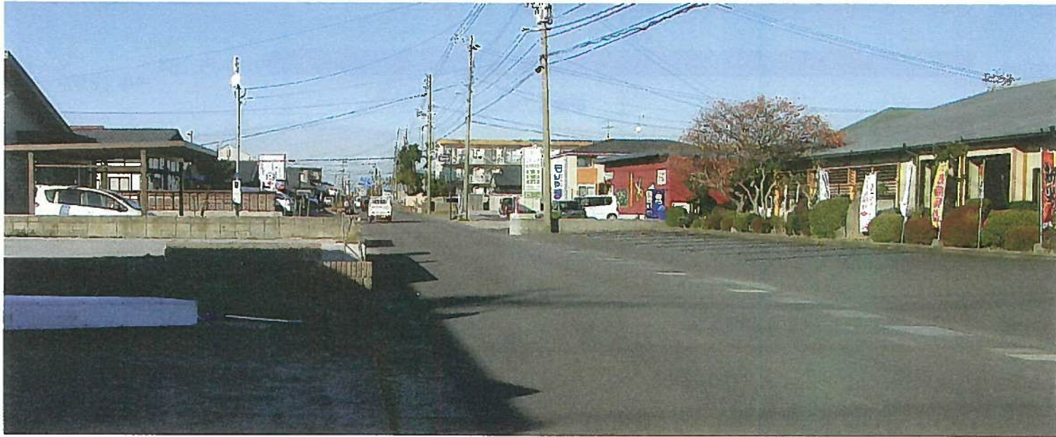
寿交番周辺より工事着工へ

この度、先生のご尽力により本予算・補正予算を編成していただくと共に、地権者等のご理解・ご協力により、一部区間の契約が締結されたことから「一定区間」での工事可能となり、令和5年2月に工事発注予定と報告がなされました。大変ありがたいことです。感謝申し上げます。