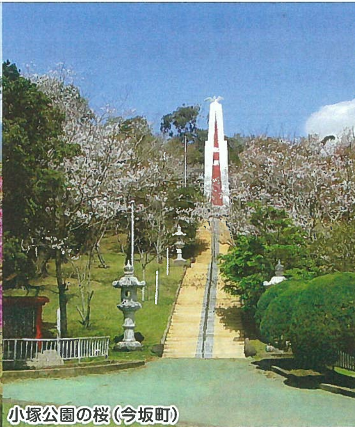
小塚公園の桜(今坂町)