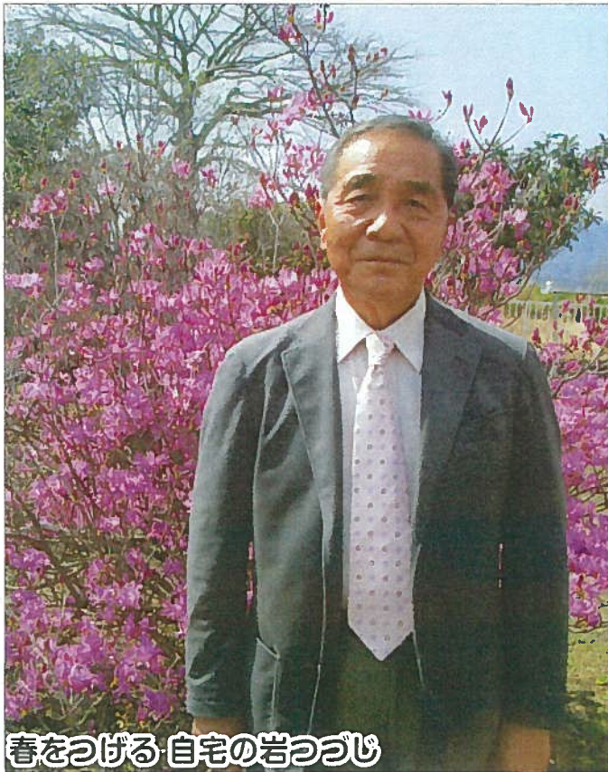
春をつげる 自宅の岩つつじ