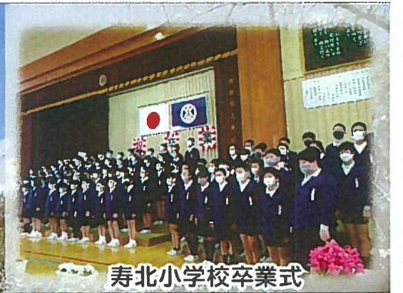
寿北小学校卒業式