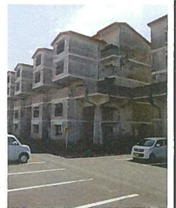
平和市営住宅 改修