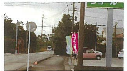
市道 東原線歩道設置へ