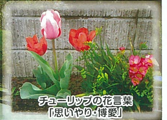
チューリップの花言葉 「思いやり・博愛」

学校の入学・進級や会社の入社などの門出を祝う時期となり、桜や草花が咲き、清々しい季節となりました。皆様には、ますますご清栄のこととお喜び申し上げます。