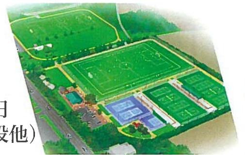
野里運動公園の鳥瞰図 ちようかんず