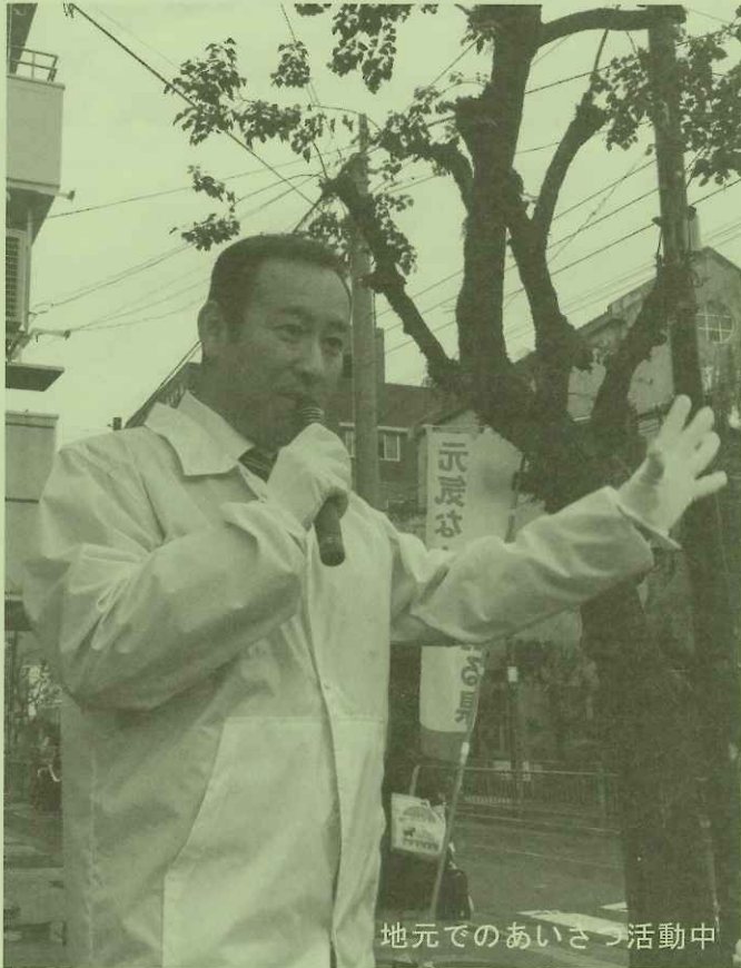
地元でのあいさつ活動中