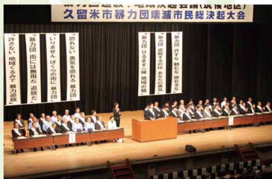
暴力団壊滅市民総決起大会では来賓としてご挨拶を行う