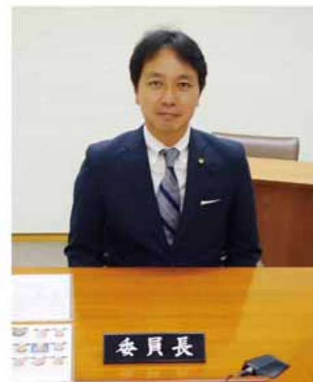
県議会常任委員会の委員長に就任しました