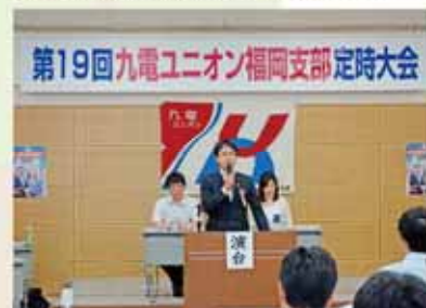
企業団体の大会では来賓としてご挨拶を行う