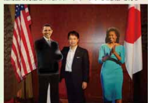
日米友好議連の副会長として独立記念日レセプションに参加