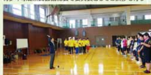
城南区で開催されたスポーツイベントでご挨拶を行う