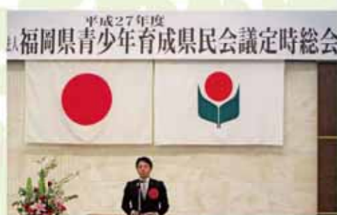
青少年育成県民会議定時総会で委員長としてご挨拶を行う