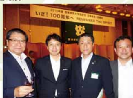
西南大学の同窓会総会で月形糸島市長と再会