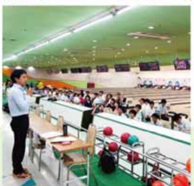
ボウリング大会の開会式でご挨拶を行う