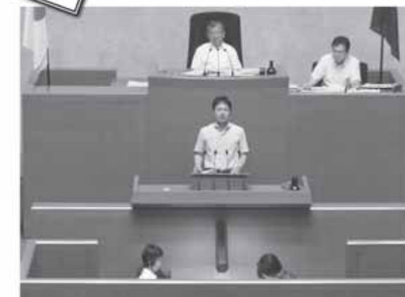
(県民の声を実現するために知事に訴えました)