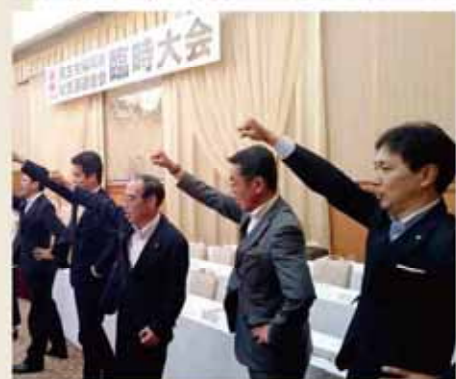
民主党県連大会で幹事長代理としてガンパローコール