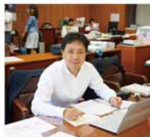
会派の幹事長に就任しました