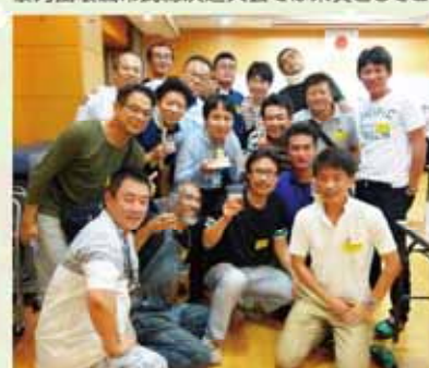
片江3校おやじの会に誕生日を祝って頂きました