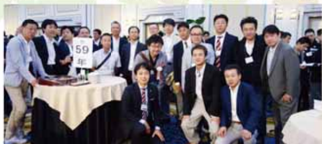
西南高校の同窓会総会で旧知の友と再会